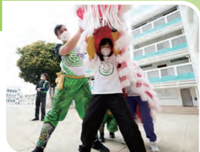
參與同學努力學習及享受龍獅舞活動

海關義工團首先透過參與龍獅舞活動中的訓練和取得的樂趣, 讓同學們能夠提升對做運動的興趣, 建立團隊合作和體育精神。此外, 香港海關射擊會希望透過推廣安全射擊, 增強同學們的自信心, 提升集中力和激發鬥志, 為同學帶來正能量。