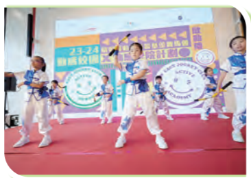
九龍城浸信會禧年(恩平)小學武術表演