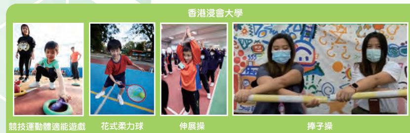
香港浸會大學 競技運動體適能遊戲 花式柔力球 伸展操 擡子操