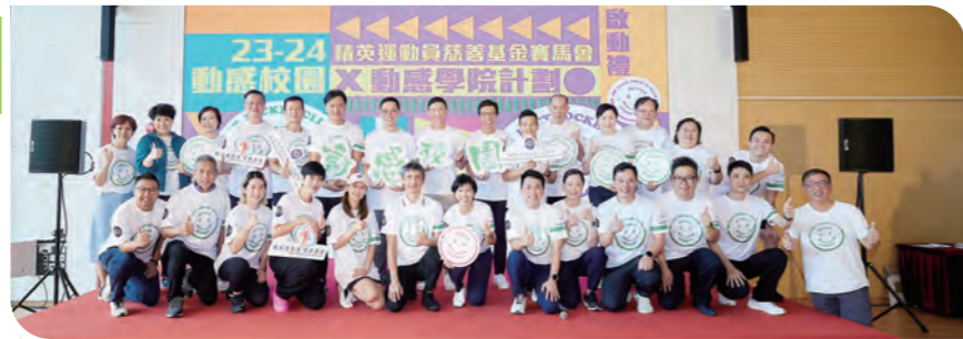
一眾主禮嘉賓、顧問團、校長、教練及香港精英運動員協會執行委員合照

「精英運動員慈善基金賽馬會動感校園及學院計劃啟動禮 2023/24」在 2023 年 9 月 16 日於消防及救護學院舉行, 並邀請到文化體育及旅遊局局長楊潤雄先生、立法局議員鄭泳舜先生、文化體育及旅遊局體育專員黃德森先生、消防處副處長(公眾安全及機構策略)陳慶勇先生、消防及救護學院院長于文陽先生、香港精英運動員協會名譽副會長吳守基先生等出席主禮, 並請來九龍城浸信會禧年(恩平)小學及空手道的教練表演武術和 Strong Nation, 為新一年的「23/24 動感校園及動感學院計劃」揭開序幕。