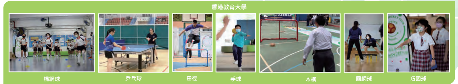
香港教育大學 棍網球 乒乓球 田徑 手球 木棋 圓網球 巧固球