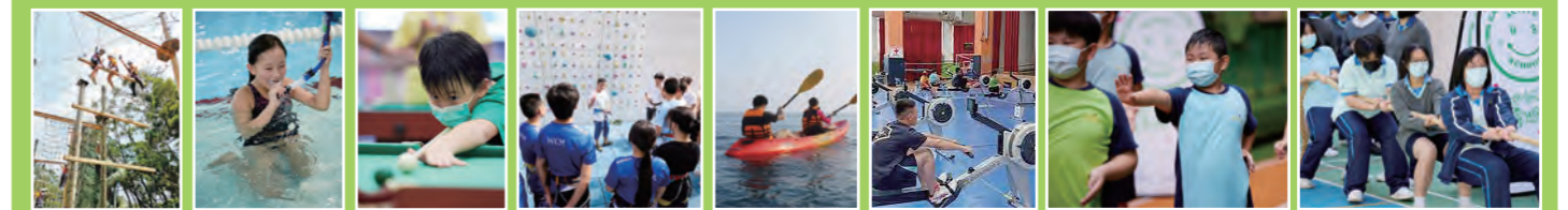
高空繩網 徒手潛水訓練 桌球 一級運動學登記書課程 獨木舟 室內划艇 中國武術 拔河