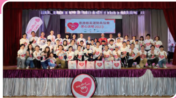
各主禮嘉賓及香港精英運動員在出發前進行大合照。