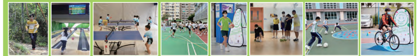
野外定向 保齡球 乒乓球 跆拳道 檯球 草地滾球 足球 單車