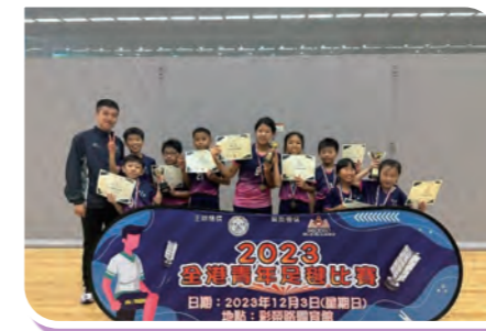
2023 全港青年足毬比賽