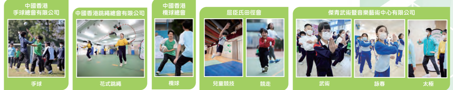
中國香港手球總會有限公司 中國香港跳繩總會有限公司 中國香港欖球總會 屈臣氏田徑會 傑青武術暨音樂藝術中心有限公司 手球 花式跳繩 檯球 兒童競技 競走 武術 詠春 太極