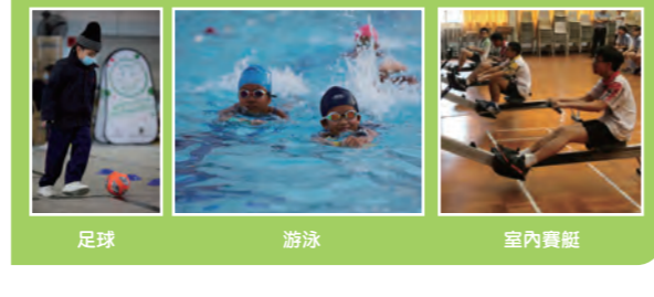
足球 游泳 室內賽艇