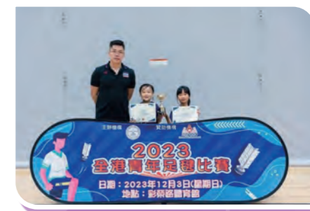
2023 全港青年足毬比賽 (2)