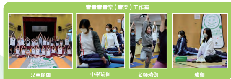
音音音樂 (音樂) 工作室 兒童瑜伽 中學瑜伽 老師瑜伽 瑜伽