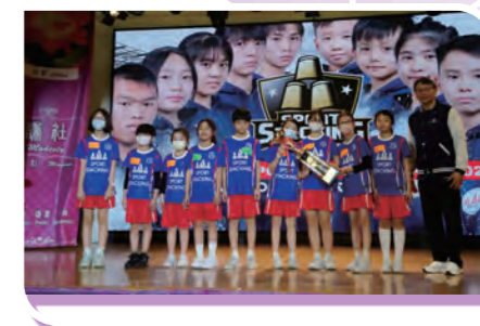
全港競技盃運動公開賽