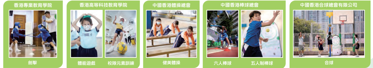
香港專業教育學院 香港高等科技教育學院 中國香港體操總會 中國香港棒球總會 中國香港合球總會有限公司 劍擊 體能遊戲 校隊元素訓練 健美體操 六人棒球 五人制棒球 合球