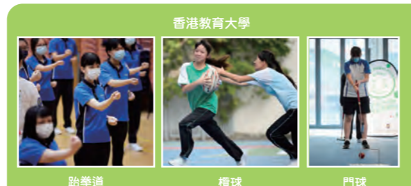
香港教育大學 跆拳道 檯球 門球