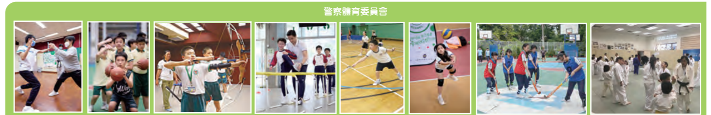
警察體育委員會 空手道 籃球 射箭 田徑 羽毛球 排球 曲棍球 柔道