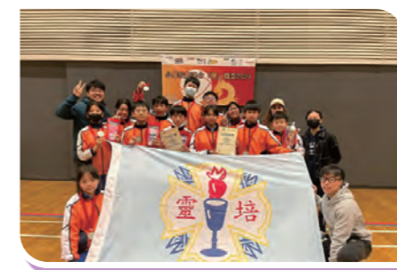
小學校際混合「健」龍邀請盃 2024 盃賽