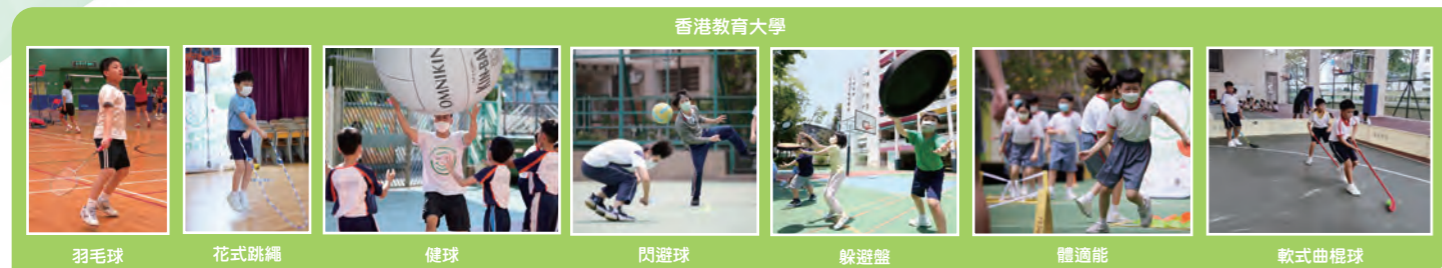
香港教育大學 羽毛球 花式跳繩 健球 閃避球 躲避盤 體適能 軟式曲棍球