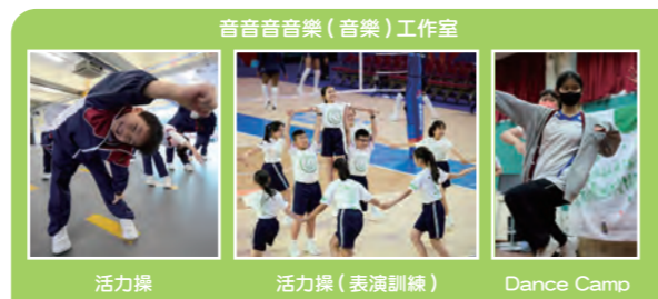
音音音樂 (音樂) 工作室 活力操 活力操 (表演訓練) Dance Camp