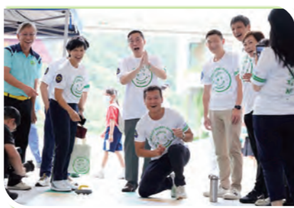
各嘉賓體驗攤位遊戲-地壺球