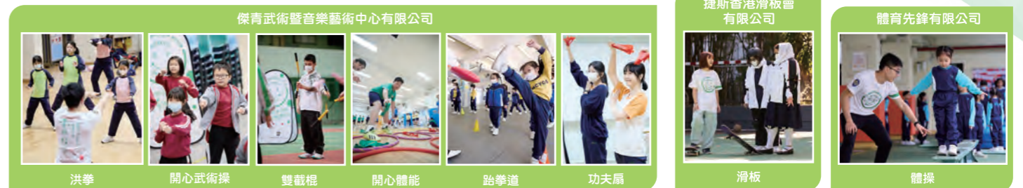
傑青武術暨音樂藝術中心有限公司 捷斯香港滑板會有限公司 體育先鋒有限公司 洪拳 開心武術操 雙截棍 開心體能 跆拳道 功夫扇 滑板 體操